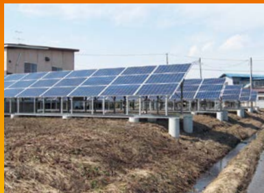
野立て・高上げ仕様