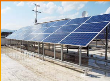
陸屋根・高上げ仕様